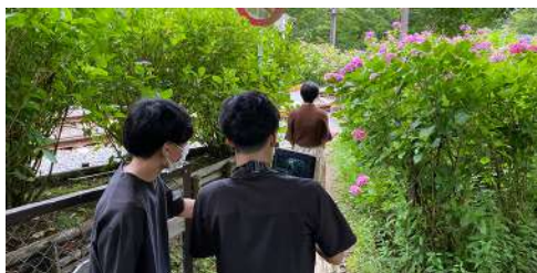
■箱根町 CM “箱根 Hakone 年間PR”

編集はAdobe Premiere Pro / After Effects / Photoshop などを使用 日本全国 対応可能範囲