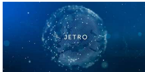
■ JETRO 経済産業省 PR映像 “EduTECH Philippines ”