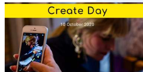
■ London Create Day PR映像